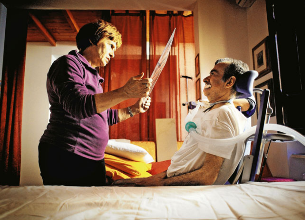
ALS-Patient, pflegende Ehefrau „Hohe Quote der Fehlversorgung“

den heiklen Hinfälligkeiten einer ALS-Patientin aber wenig vertraut sind.